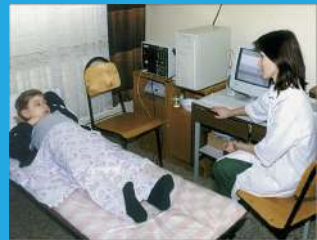
Коррекция опорно-двигательного аппарата