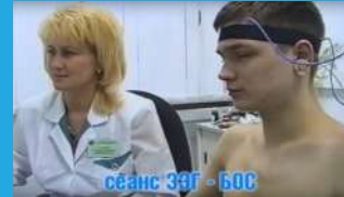
Коррекция психоэмоционального состояния