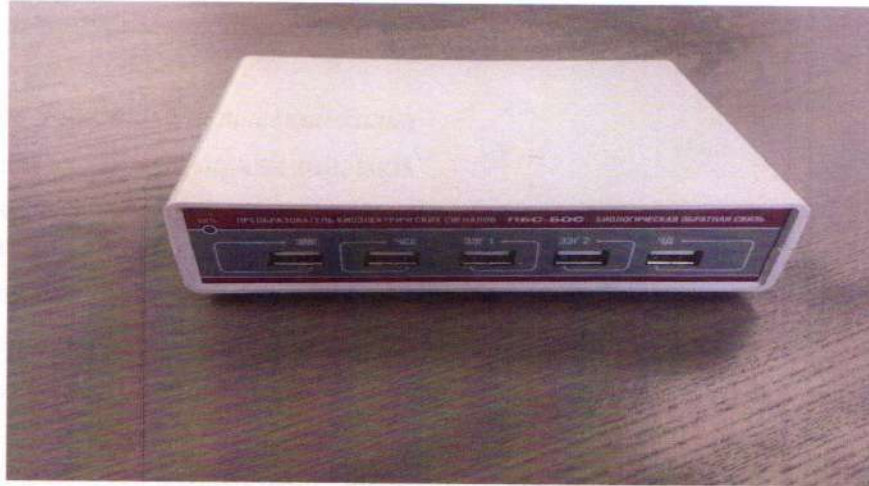
Рисунок 2. Внешний вид преобразователя

От несанкционированного вторжения преобразователя защищены пломбировочными наклейками в местах закрепления составных частей корпуса (рисунок 3).