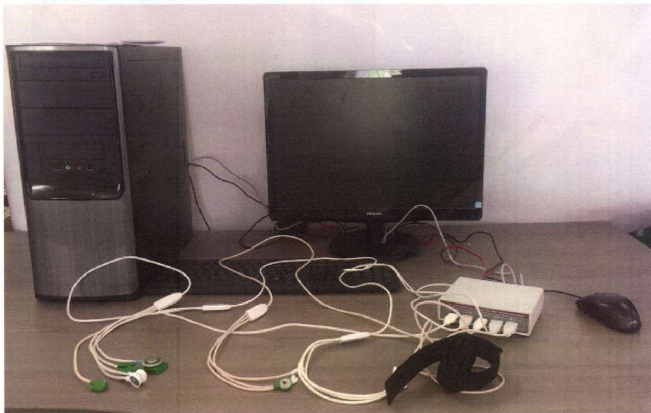
Рисунок 1. Общий вид преобразователя с датчиками и персональным компьютером

Преобразователь работает в комплексе с персональным компьютером и подключенными к его входу датчиками с кабелями и встроенными предварительными усилителями (рисунок 1).